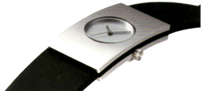
62 Geformte Zeit, Niessing