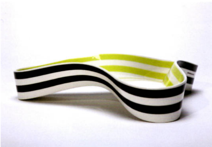
42 Schweizer Keramik, Andreas Steinemann