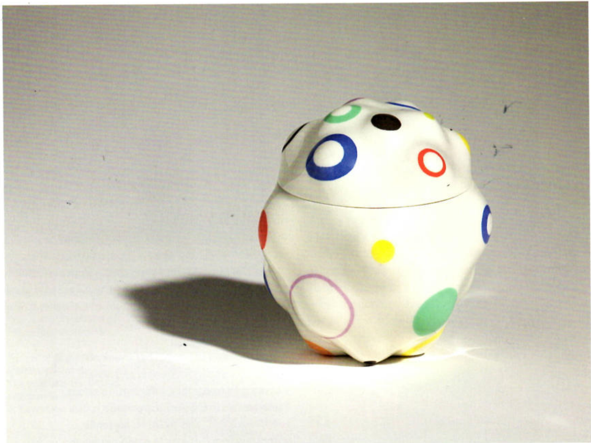
Andreas Steinemann, Dose, Porzellan, H 12,5, D 11 cm. Can, porcelain.

The boundaries between applied art and fine art are also fluent among Swiss ceramists. Here are three examples, selected in collaboration with Form Forum Schweiz.