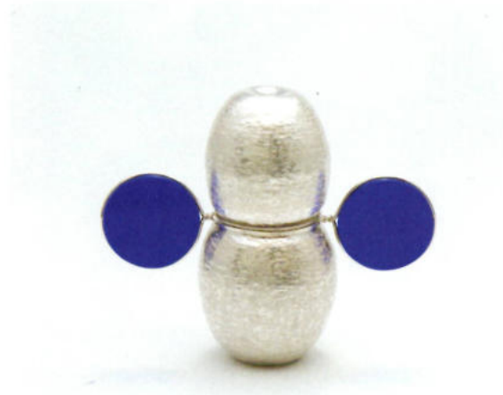
102 17. Silbertriennale, Ear-Box von Paul Derrez