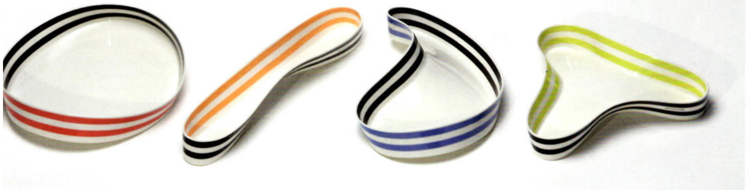
Collection 08 , Form 1–4. Porzellan. D 27–40 cm. Porcelain.