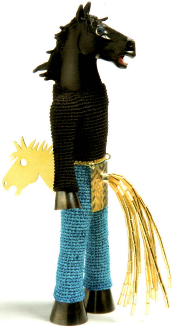
108 Unvergessliche Geschichten, Felieke van der Leest