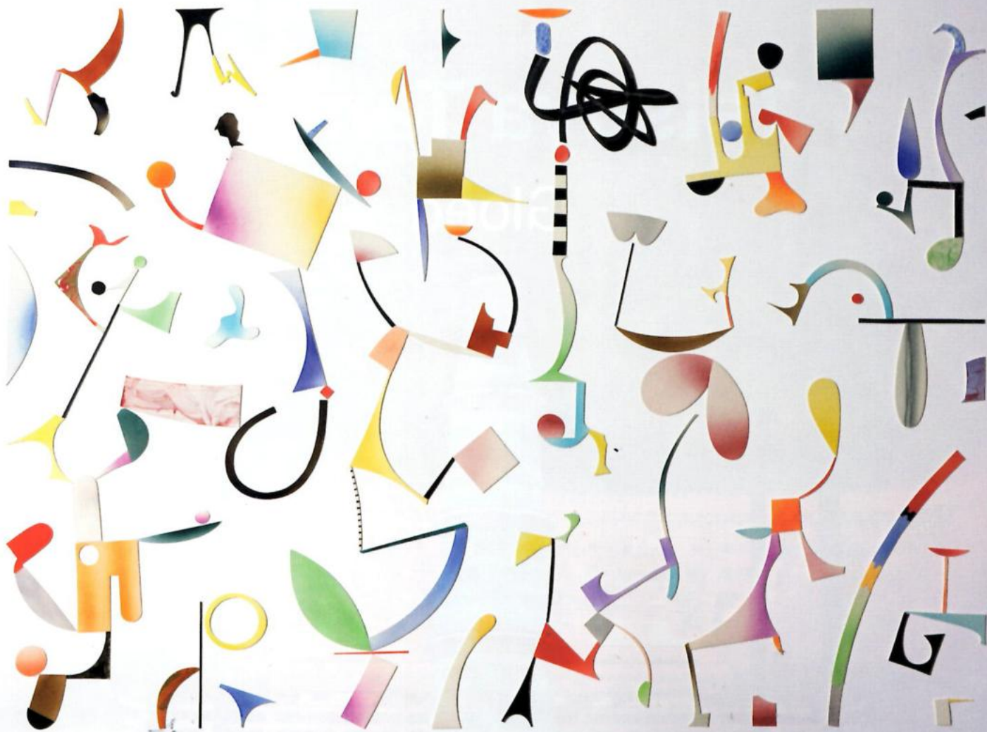
† Linksboven: Collection 08/3, 2008, gegoten porselein en zeefdruk, 27 x 27 x 6 cm Linksonder: Collection 08/2, 2008, gegoten porselein en zeefdruk, 40 x 8 x 6 cm Boven: Fragment, 2023, porselein, 345 x 250 cm

maal een thema gevonden heeft, begint hij met ontwerpen. 'Ik heb een idee welke kant het op moet gaan en ga schetsen, tot het wat verder uitgekristalliseerd is. Het maken van modelletjes uit papier of klei kan daarbij helpen. Het is een proces van zoeken en kiezen, en dat is best lastig. Ten slotte is het belangrijk te kijken naar de haalbaarheid van wat ik bedacht heb: de functionaliteit moet kloppen en het moet maakbaar zijn. Als ik eenmaal mijn keuze gemaakt heb, is het een kwestie van uitvoeren en kan ik overgaan van denken naar doen. De routine kan het dan overnemen.' De laatste tijd giet hij zijn producten. Aan de