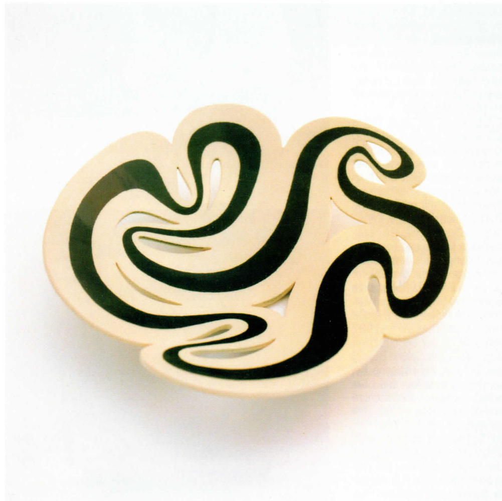
Schale, Steinzeug, 1996. ø 41cm. ■ Bowl, stoneware, 1996. ø 40cm.